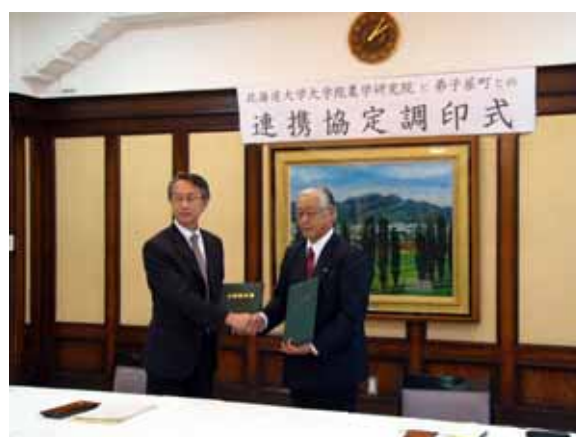
北海道大学農学研究院長と徳永町長

このほかに生涯学習等の分野で、「北海道教育大学釧路校」と平成 19 年 8 月 7 日に相互協力協定が締結されています。