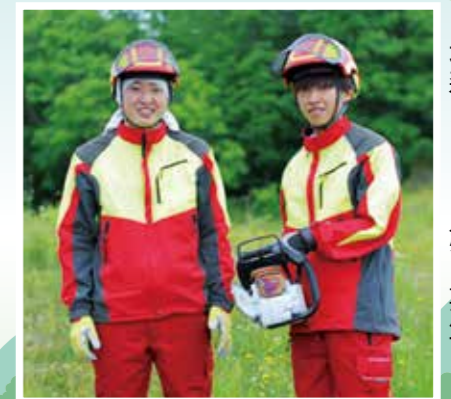
北森カレッジ 第1期生