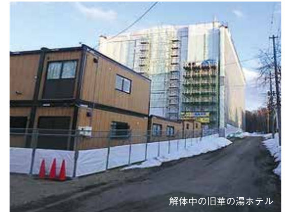
解体中の旧華の湯ホテル

※新型コロナウイルス感染症の状況により、予告なく規模を縮小する、もしくは一般公開を中止する場合があります。