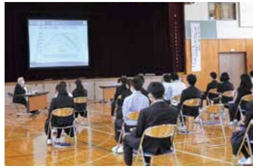
郷土を学び誇れるまちに