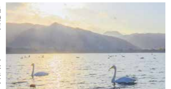
屈斜路湖の自然環境の保護

問い合わせ先／役場まちづくり政策課政策調整係 ☎ 4 8 2 - 2 9 1 3 (課直通)