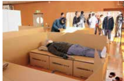
段ボールベッドを体験

避難所内では、着替えや防寒着の携行の他に、「マスクの装着、スリッパの持参」など、個人ごとにさまざまな感染防止処置が必要なため、広報10月号および11月号の「防災ワンポイント」をご覧ください、普段から必要な物品の準備を心がけましょう。