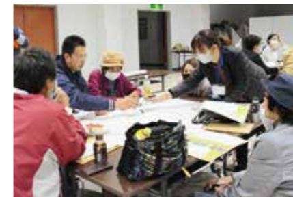
町の景観について町民の皆さんと談義(弟子屈町まちなみ探検)

町民の声 (自由記載から一部を掲載) ○温泉という観光資源があるのに、町内に温泉施設がないのはもったいない。 ○育児をするようになり、充実したさまざまなサポートに満足しています。 ○免許を返納した場合、町内外の交通手段に困る。 ○町内の施設、建設物、街並みにもっと統一感があつたら良い。