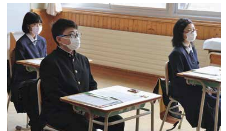
だれもが安心して教育を受けられる環境づくりを