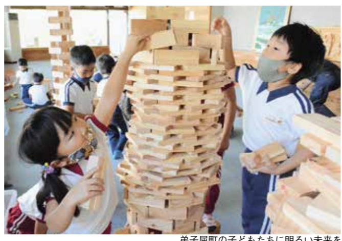
弟子屈町の子どもたちに明るい未来を

町民の声 (自由記載から一部を掲載) ○温泉をもっと活用して町に人を呼んでほしい。 ○若者が働けるような、観光業に強い企業を誘致してほしい。 ○夏期間だけでも、野菜などのテント市を開催してみてもどうか。 ○住みよい町かつそれぞれの店の対応もよく、非常にありがたいです。