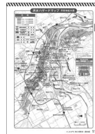
「てしかが町知って得する便利帳」にも掲載

本町においても町内各地で浸水やがけ崩れなどの被害が発生しています。今後も、土石流、がけ崩れなどのおそれがあり、「大雨警報」と「土砂災害警戒情報」が発表された場合は、避難勧告を発令する可能性がありますので、発令された場合は、速やかな避難準備を行ってください。また、各ご家庭でも、どこに避難するかについてしっかり話し合っておきましょう。