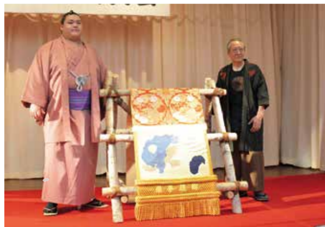
町のシンボル「摩周湖」「屈斜路湖」があらわれた化粧まわし