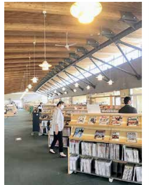
他町の施設の視察

問い合わせ先／役場まちづくり政策課地域振興室地域振興係 ☎ 4 8 2 - 2 9 1 3 (課直通)