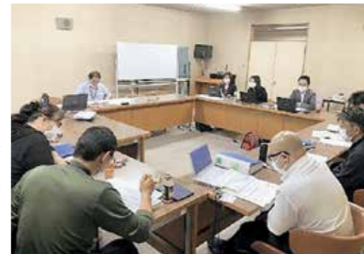
ワーキンググループの会議の様子

基本計画の概要が決まり次第、3月中をめどに町民の皆さんから意見を聞く機会としてパブリックコメントの実施を予定していますので、皆さんからのたくさんの意見をお待ちしています。公開は役場まちづくり政策課窓口と町公式ホームページへの掲載を予定しています。