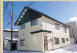
川湯ゲストハウス「NOMY」

開業すべく準備を進めているところです。改修作業は知らないこと、やったことがないことばかりで、自分で調べたりプロの方に聞いたりしながら試行錯誤状態ですが、友人たちもたくさん駆けつけてくれ、楽しみながら作業しています。 そして、ゲストハウスの屋号ですが、「川湯温泉ゲストハウス NOMY(ノミー)」に決定しました!「NOMY」は英語で「学、か、深く知る」という意味があるのですが、弟子屈をより深く知ってもらいたいという意味と、私はひとりで遠くまでと距離が近くなれる「飲み」会が好きなので、ここを訪れる旅人たちも一緒に「過」すひとりで弟子屈とくっつき距離を縮めてほしいという意味を込めました。 3月末にプレオープンし、本格的なオープンはゴールデンウィークを予定しています。川湯で飲む際や仲間内の集まりの場としてなど、町民の皆さんにも気軽に利用してもらえらる宿にしていきたいと思っています。引き続きよろしくお願いいたします。