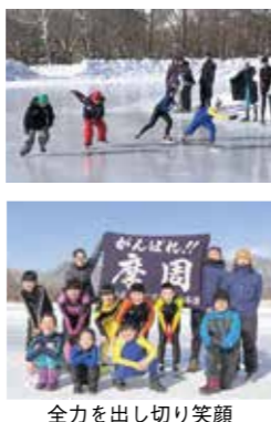
全力を出し切り笑顔

町立小・中学校体育館 利用者募集します 町教育委員会では、学校教育活動に支障のない場合、町内の小・中学校の体育館を一般のスポーツ団体に開放しています。令和3年度に体育館の利用を希望される団体の登録受け付けを開始します。 ▼事業名／学校施設開放事業 ▼開始日／平日 ▼協力金／1人1回160円 ▼登録可能な団体／10人以上で構成された町内の団体 ▼登録締め切り日／3月12日(金) ▼申し込み・問い合わせ先／町教育委員会社会教育課スポーツ係 ☎ 4 8 2 - 2 9 4 8 (課直通)