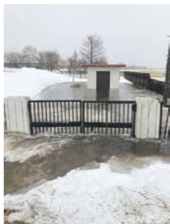
≪平成30年3月の融雪洪水の際に冠水した弟子屈原野の水道施設≫

また、町からまだ避難指示・避難勧告が発令されていないような状況であっても、危険だと思われた時には、早目に安全な公共施設や親戚・友人宅、ホテルなどに避難するか、避難が間に合わないと思った時は家の中の高い所に避難しましょう。また、危険な状態を察知した場合には、すみやかに役場に通報してください。