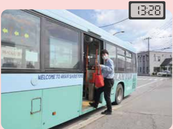
摩周湖農協 から乗車

・通院と、金融機関での支払い、お昼ごはん、買い物までゆっくり行くことができました。