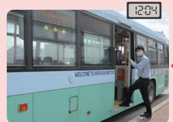
摩周大通 から乗車