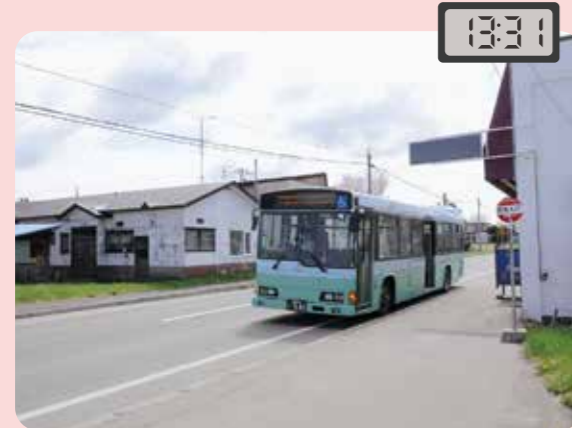
団地入口 （キッチンくいしんぼう付近）で降車

・通院と、金融機関での支払い、お昼ごはん、買い物までゆっくり行くことができました。