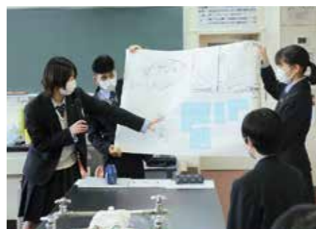
生徒によるグループ発表

町では、1月23日(日)13時30分から町公民館で、町民の方を対象にした研修会を行います。まちの未来のために何ができるのか。自分ができる「マイターゲット」を見つけに、ぜひご参加ください。