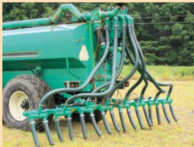
▲臭気抑制スラリー散布機による散布風景

堆肥やスラリーの散布は5月、7月、11月頃に集中して行われ、観光シーズンとも重なりますが、農業にとって必要不可欠なことから、ご理解をお願いします。