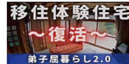
弟子屈町の移住体験住宅が復活！！