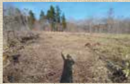
小さな村のスタート