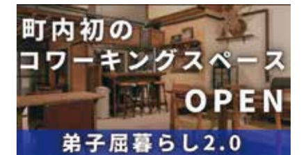
町内初のコワーキングスペースが誕生！ #弟子屈JIMBA