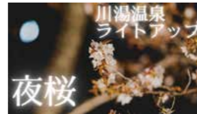
川湯温泉の桜がライトアップ