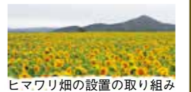
ヒマワリ畑の設置の取り組み

実施状況は弟子屈町公式サイト「農業」のページでもご紹介していますので、ご参照ください。