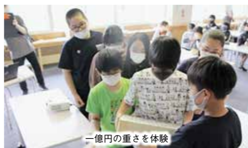
一億円の重さを体験