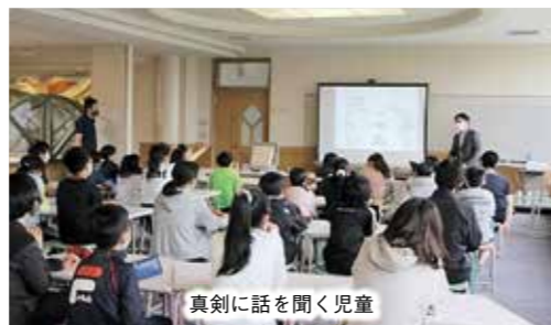
真剣に話を聞く児童

教室の最後には公益法人釧路地方法人協会がアンケートを実施し、児童からは「思っていたより税金が色々なところで使われていておどろいた」などの感想が寄せられました。