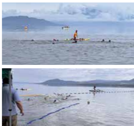
大自然の中練習の成果を發揮

第3回屈斜路湖オープンウォーター・スイミング大会が、同実行委員会主催で8月14日、屈斜路ウォータースポーツ交流公園で開催されました。 大会には138人が参加。東京オリンピックにも出場した選手も参加し、皆さんは屈斜路湖の雄大な自然の中、日頃の練習の成果を思う存分発揮していました。