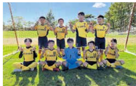
大活躍をした皆さん

サッカー少年団大活躍 JFA U-12サッカーリーグ2022釧路地区リーグが、4月30日に釧路町で開催され、摩周