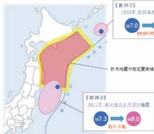
後発地震の発生事例

歴史上、後発地震が必ず発生したわけではありませんが、巨大地震が発生した際の甚大な被害を軽減するため、後発地震への注意が大切です。家具の固定や安全な避難場所・避難経路の確認、非常持出品を常に携帯しておくなどして備えましょう。