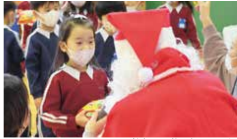
笑顔でお礼を伝える園児