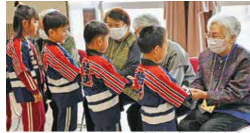
発表後にお礼の言葉と握手を