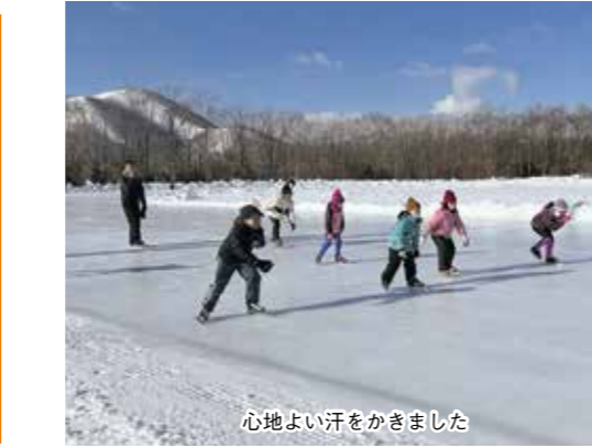
心地よい汗をかきました

町教育委員会では、釧路市を本拠地とするプロアイスホッケーチームである、ひがし北海道クレインズの観戦ツアーを実施します。対戦 / ひがし北海道クレインズ 対レッドイーグルス北海道 期日 / 2月18日(土) 会場 / ひがし北海道クレインズアリーナ