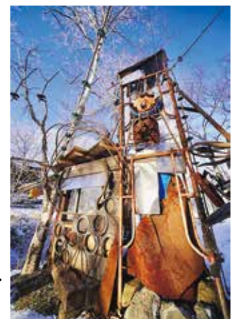
柏木ひろあきさんの作品