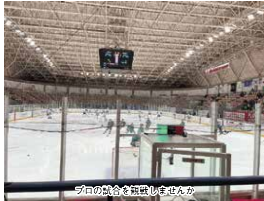
プロの試合を観戦しませんか

※チケットをご自分で用意された方も、バスの利用ができます。 ※ゲームが中止の場合は、町教育委員会から連絡します。 □申し込み・問い合わせ先 / 町教育委員会社会教育課スポーツ係 ☎482・2948 (課直通) まで。 ▼コース / 桜ヶ丘森林公園内 気象状況により、コースを変更することがあります。 ▼申し込み締め切り / 2月17日(金) ※小学生以下の方は、保護者同伴で参加してください。 ※歩くスキーがない方には、教育委員会社会教育課スポーツ係で貸し出しています。☎482・2948 (課直通) まで、お問い合わせください。 ※新型コロナウイルス感染症の拡大状況によって中止する場合があります。 □申し込み・問い合わせ先 / 上枝スポーツ ☎482・2285 まで。