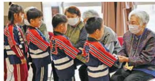
発表後にお礼の言葉と握手を