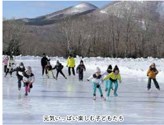
元気いっぱい楽しむ子どもたち

冬休みにスケート教室で心地よい汗 町教育委員会主催のスケート教室を1月7・8日、町営スピードスケート場で開催しました。冬期間の子どもたちの体力向上と、ウインタースポーツを通じて元気で活力のある子どもたちを育てることを目的に、毎年開催しているものです。今年は54人が参加しました。 教室では、4人のスケート経験者の指導のもと、スケートの滑り方や転び方などを学習。子どもたちは寒さに負けず、ウインタースポーツを元氣いっぱい楽しんでいました。