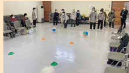
新年も楽しく活動