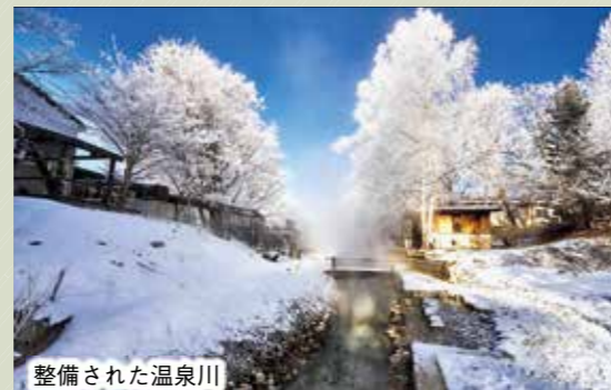
整備された温泉川

問い合わせ先/役場観光商工課観光振興係 ☎ 4 8 6 - 7 7 3 1 (係直通)