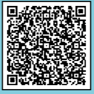
町公式ホームページ

基本設計業務を進めるにあたり参考とさせていただくワークショップなどの進め方や開催状況の情報を中心に、中心市街地地区のエリアリノベーションに関する取り組み、旧営林署跡地での動きなどについては、スケジュールなどをお知らせするページを町公式ホームページに新たに作成しました。こちらで順次お知らせをしていきますので、ご確認いただくと共に、ご協力をいただきますよう、よろしくお願いいたします。