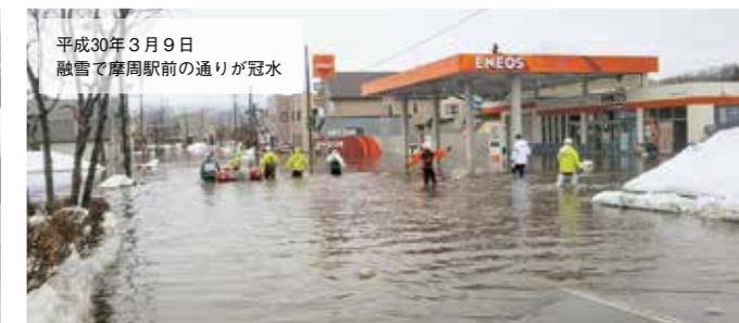
平成30年3月9日 融雪で摩周駅前前の通りが冠水

問い合わせ先／役場総務課防災情報係 ☎ 4 8 2 - 2 9 1 2 (課直通)