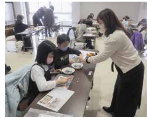
自分だけの作品を