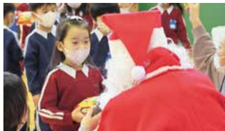
笑顔でお礼を伝える園児