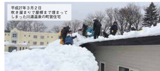
平成27年3月2日 吹き溜まりで屋根まで埋まってしまった川湯温泉の町営住宅