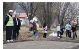
早速走り幅跳びに挑戦する児童