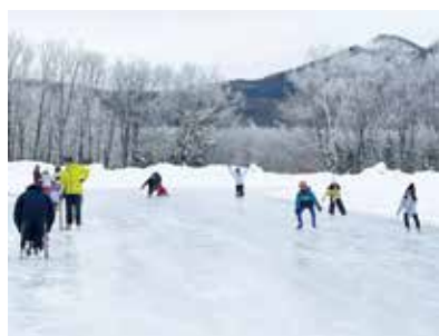
スケートを楽しむ子どもたち

冬休みにスケート教室で心地よい汗 町教育委員会主催のスケート教室が1月10日、町営スピードスケート場で行われました。冬期間の子どもたちの体力向上と、ウィンタースポーツを通じて元気で活力のある子どもたちを育てることを目的に、毎年開催しています。今年は33人が参加し、シーズン到来を喜びました。