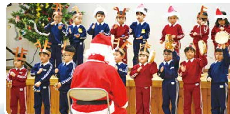
みんなでサンタさんに演奏を披露