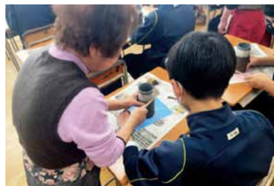
指導を受けながら制作【弟子屈中学校】