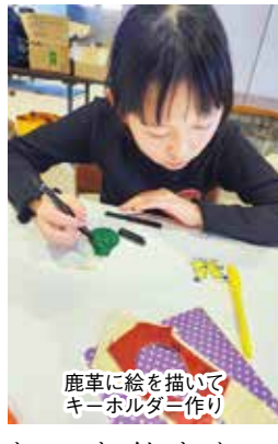
鹿革に絵を描いてキーホルダー作り