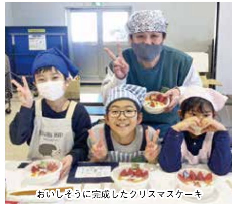
おいしそうに完成したクリスマスケーキ