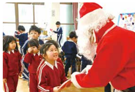
サンタさんから素敵なプレゼント