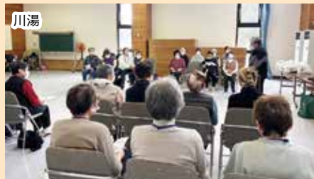
新年も楽しく参加