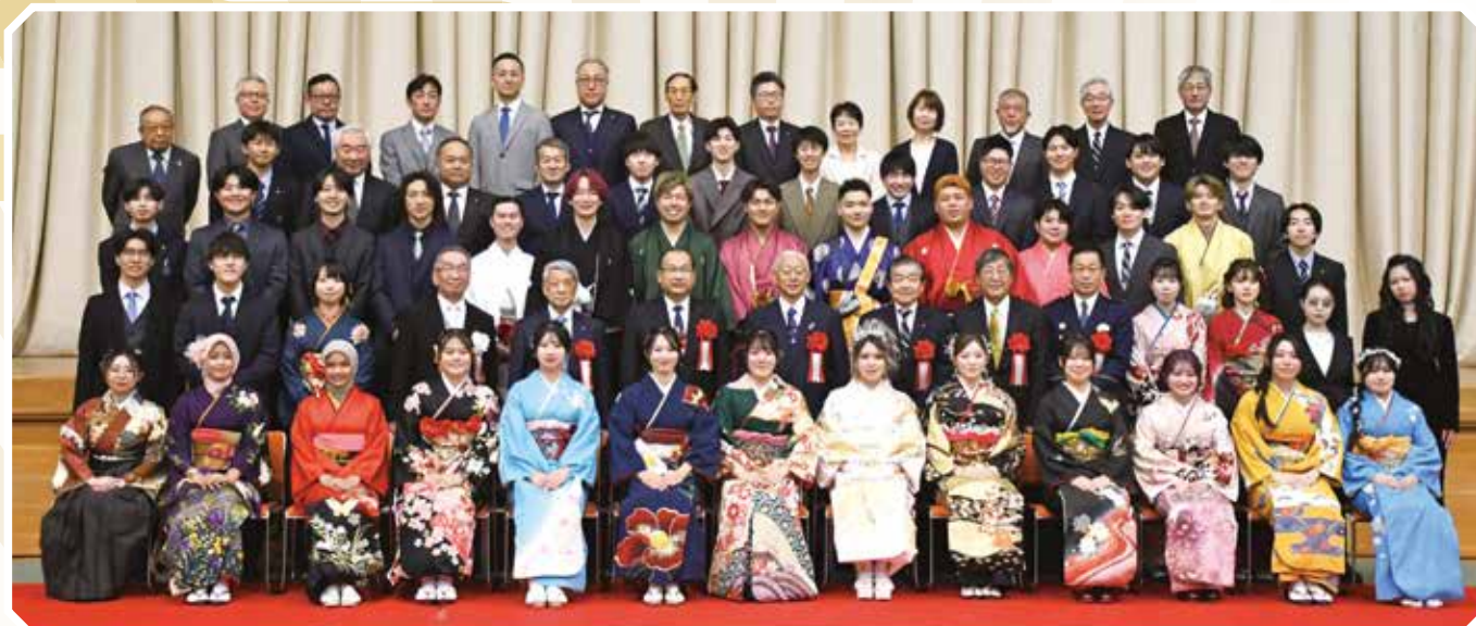
出席者で記念撮影