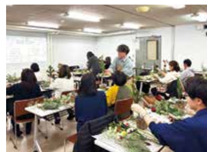
楽しんで制作しました