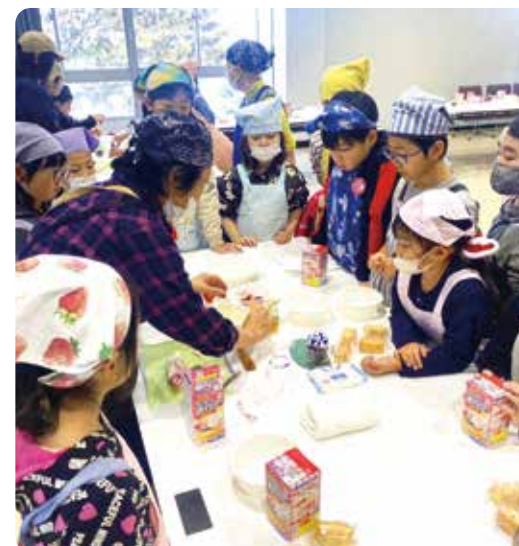
クリスマスケーキ作りを体験