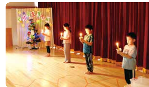
園児たちによるキャンドルサービス