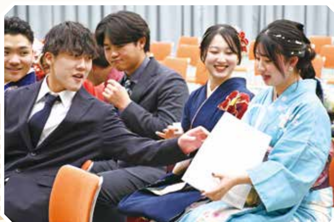
式典後の抽選会での様子