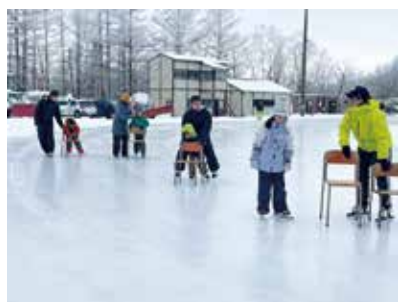
椅子を使用した練習