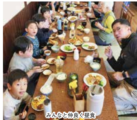
みんなと仲良く昼食