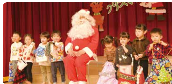
プレゼントと一緒に記念撮影