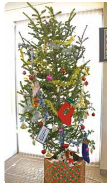
今井林業(株)から贈られたツリー