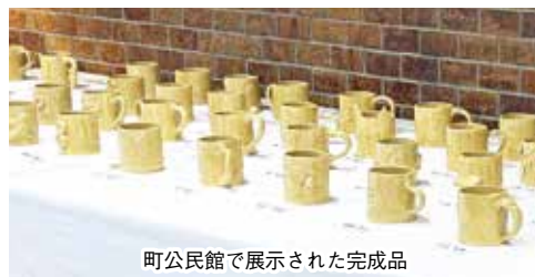
町公民館で展示された完成品