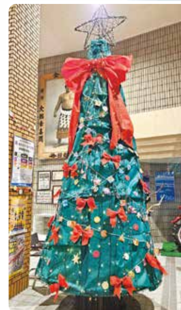
こども園の園児たちが飾りつけたツリー