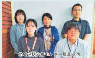
地域包括支援センター職員一同