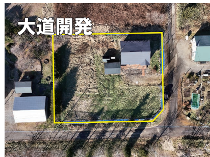
▲敷地境界は正確ではありません