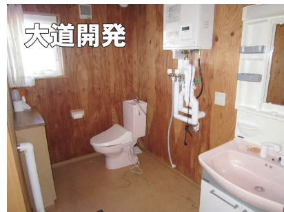
▲脱衣洗面所・トイレ