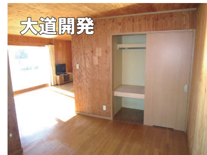
▲約6帖洋室 (左奥：約15帖LDK)