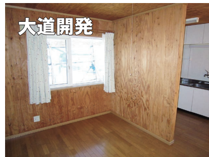
▲約6帖洋室 (右奥：台所)