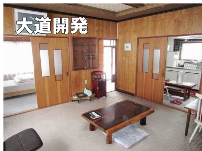
▲約9.8帖LD (左奥：洋室/右奥：台所)