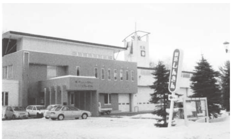
釧路信金川湯支店統廃合後について

「しんきん」側も統廃合に当たっては、特段の配慮をされており、地域利用者に不便のないようにしている。年金を受給する高齢者へのサービスを、詳しく職員を通じてご案内することである。また、硬貨巻機については、現状では設置する予定はないが、再度申し入れをしたいと思う。