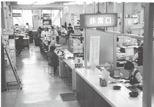
機構改革への考えは

今後の機構改革については、平成23年第3回町議会定例会でお答えしたとおり、平成24年度の任期中に見直しを行いたいと考えている。特に、平成25年3月末の退職者数が10人となることから、機構改革などを平成25年度当初から実施することを考えている。今後、早い機会に取りまとめ、議員の皆さんのご意見を伺い、平成25年4月1日から実施することを取り進めているので、ご理解をいただきたい。