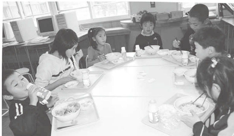
より安全な給食を提供するための体制づくりを

図書館機能の充実を ボランティアの参加は、研修や活動の場に関する情報の提供など、参加促進を図っていく。貸し出しには制約が伴うが、利用者調査、需要の把握に努め、善処したい。新年度からは、ネットを通じての蔵書検索や貸し出し予約24時間体制が可能になる。今後の利用状況を勘案しつつ、考慮していきたい。