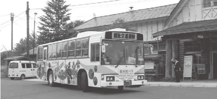
昨年の観光交通実証運行

●日時／2月22日(水) 10時 ●場所／役場3階議員控室 ●会議事件／「摩周・屈斜路環境にやさしい観光交通実証運行」に係る平成23年度事業報告および平成24年度事業概要について