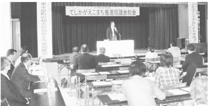
観光関連団体の一元化を

い。しっかりとリーダーのもと、立て直してもらいたい。川湯駅前前の観光のまちづくりに対する努力と取り組みを評価したい。既存の組織の連携を強化していきたい。