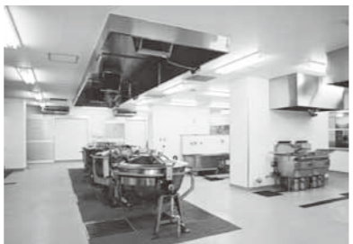
給食センターに測定器を配置

町長答弁 史上最悪レベルとなる大量の放射性物質をまき散らした東京電力福島第一原発事故。大気中への放出や汚染水の流出など、国民生活のすべての分野に悪影響を与えている状況である。食の安全、安心を担保する観点から、学校給食、保育所、保育園で提供される食材を検査するために放射性物質検査機器を購入すべきであり、検査品目、公表体制について伺う。