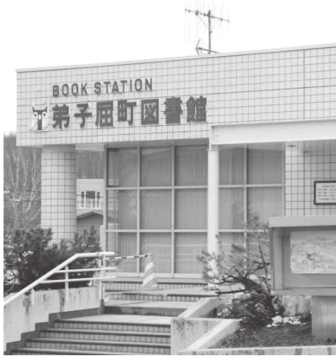
図書館機能の充実を

問 図書館の役割の拡大は重要な方に向けたサービスの増加、大活字本の整備、拡大図書機その他便利なオーディオ機器の設置など。また、図書宅配サービス、読み聞かせの高齢者版など。歩行困難な方々へのバリアフリー機能の強化。ホームページ「子どもページ」の魅力化。円滑な図書館運営に不可欠な図書館サポーターや委員の選出などについて伺う。