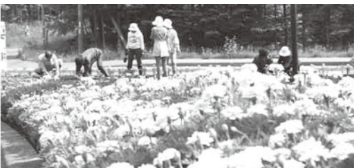
町ぐるみで展開される花いっぱい運動