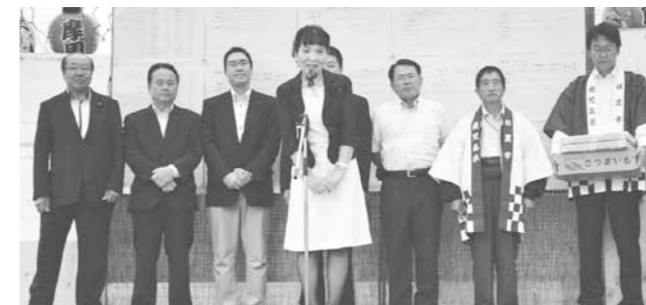
今年30周年を迎える日置市との姉妹都市交流(昨年の様子)

◎平成25年度弟子屈町一般会計補正予算について 歳入歳出予算の総額にそれぞれ204万4千円を追加し、70億1千233万1千円とした。