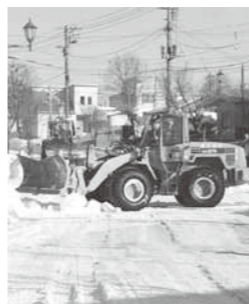
大雪のため除雪費を増額

●平成24年度一般会計補正予算について(専決第5号) 歳入歳出予算にそれぞれ450万円を追加し、総額