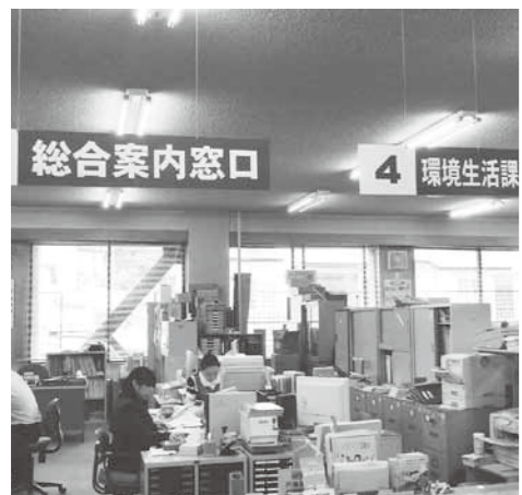
時代に即し分かりやすい課名に

第5次弟子屈町総合計画を達成するための組織編制をすること、事務分掌条例の改正と併せ、町民をはじめ来庁する皆さまが分かりやすい、時代に合った課の名称変更をしたものである。環境生活課もこのような考えのもと「町民課」から名称を変更したものであるが、広い意味での町民生活を新しい課名の生活に包含することで、旧町民課の窓口的なイメージなどを損なうことがないと考え変更した。いずれにしても、町民サービスの充実には十分配慮していきたい。また、課の名称についても、その時代に合ったもの、町民に親しまれ分かりやすいものにしてほしい。加えて、今回のご質問に対しては町民の皆さまのご意見を十分聴きながら対応してまいります。