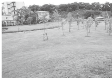
供用開始となった摩周温泉公園