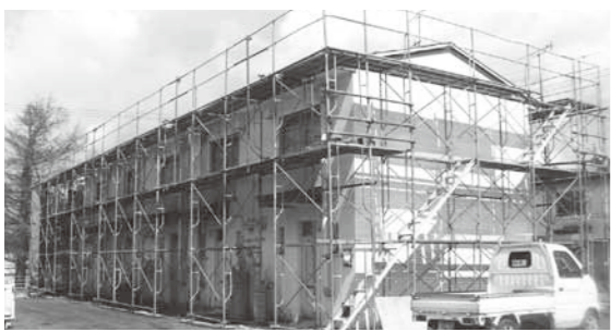
改修中の鉛別公住

4月28日の暴風被害は、鉛別公住2棟の屋根およびトタンが剥がれ、仮押さえの応急措置を実施。早急に修繕対応し、5月27日に完了。泉団地で解体後の住民は優先的に新公住に入居するため、他地域からの入居はその後となる。緊急度を勘案し、鉛別公住建て替え事業は計画を前倒し