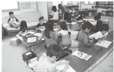
子どもたちの放課後を見守る児童クラブ

答 児童クラブは3クラブと児童館が1施設。指導員は23人配置しており、いじめなどの報告はない。避難訓練については、危機管理マニュアルを作成し、今後取り組んでいく。