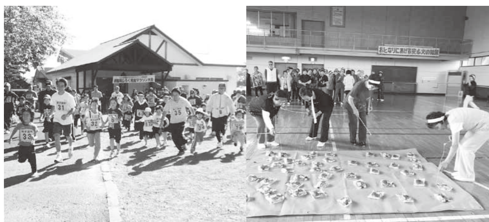
さまざまな社会教育事業を展開

昨年度の社会教育事業実績は、教育委員会の主催23事業、参加者は延べ1万1千500人ほど、社会教育関係団体などによる開催の実施および町教育委員会が援助や後援を行っている26事業、参加人数延べ1万3千400人ほどとなっている。次に事業に係る保険の状況だが、その事業内容によって全てが加入しているものではないが、事業内容により「レクリエーション傷害保険」「スポーツ安全保険」などに加入している。昨年度の加入実績は主催9事業、後援など15事業。このような状況とはなっているが、思いがけない事故やけがに対する体制の充実を図