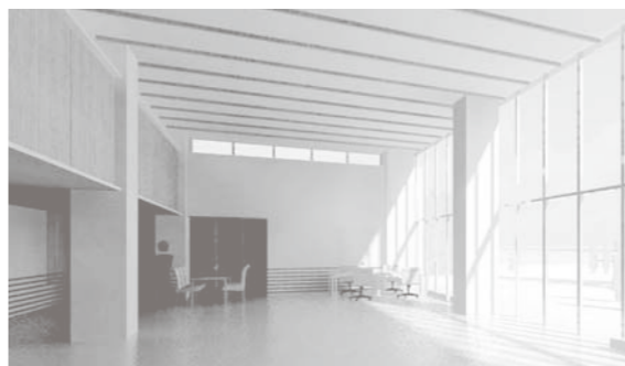
新しい老人ホームの地域交流ホール(予想図)

答 町長答弁 最近建設の公共施設などには地場産材が多く使用されてきており、計画的に建て替えを行っている