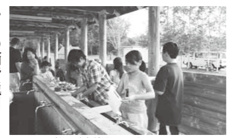
桜ヶ丘森林公園のバーベキューコーナー

◎桜ヶ丘森林公園の設置及び管理に関する条例の一部を改正する条例の制定について(議案第71号) 一部老朽化した施設の撤去に伴う施設名の削除、公園の開園期間や施設の供用時間の見直し、またA・Bに分かれていたキャンプ場のフリースァイトテント使用料を含め一本化を図