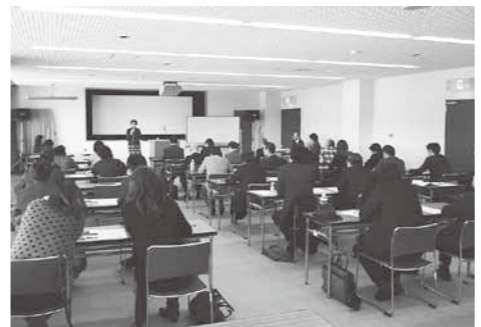
観光関係団体の先導的役割を期待

じ、保護に動かないで、居場所が他に漏れることがないように住民情報に警告画面を設定している。また、町独自の緊急避難支援や自立生活への支援を目的に「弟子屈町DV被害者緊急支援資金交付要綱」を定め、関係機関から評価をいただいている。身近な相談は社会福祉係や保健師、警察の担当係になるが、ごく限られた関係者で慎重に対処し、間違いのないよう努めていく。