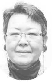
高砂 弥生 議員 一般質問