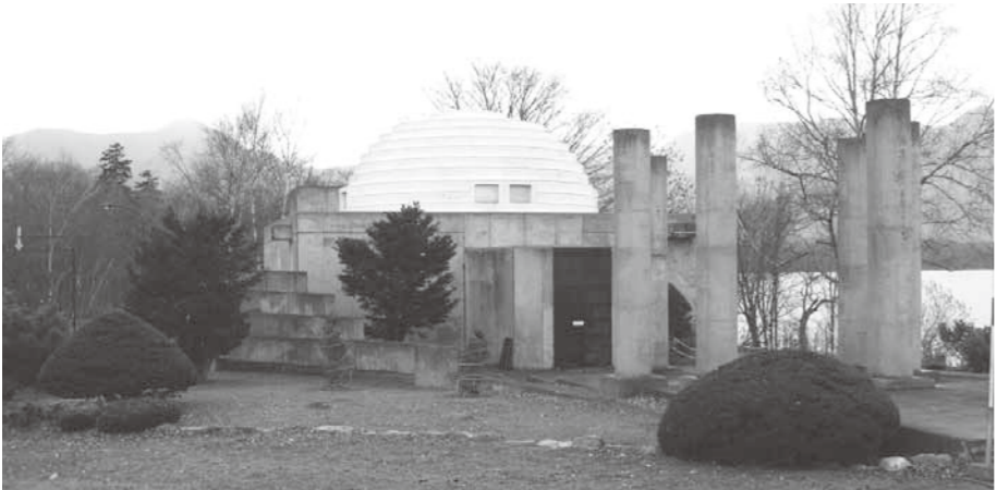
アイヌ文化を活用したまちづくりを

平成22年に加盟した「北海道縄文のまち連絡会」も、発足時の4市2町から現在は26の市町が加盟し、積極的に活動している。北海道・北東北の縄文遺跡群の世界遺産登録を目指し運動されているのも、加盟自治体首長が関わっていると聞