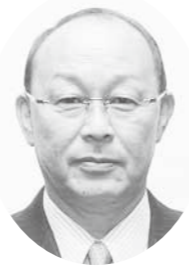
鈴木 康弘 議員 一般質問

人口減の問題は、本町にかかわらず多くの自治体で直面している課題である。隣町の鶴居村では、中学生までの医療費自己負担分を助成、第3子に恵まれた養育者に30万円の祝い金、就学する年度に就学祝い金20万円と、幅広く子育て世代に施策を実施している。本町の産業構成人口は、一次・二次産業27.4%、三次産業72.6%と、国勢調査の数字からみても雇用の多くは中小零細企業が中心である。過去12年間