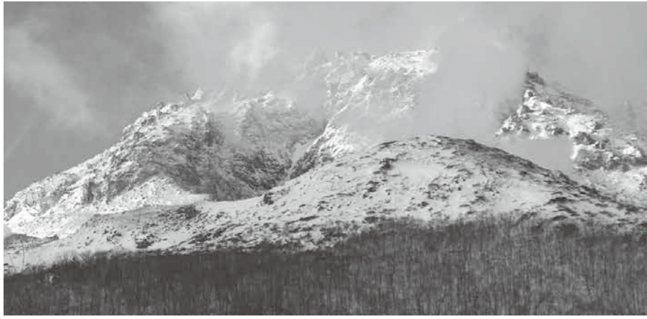
硫黄山の観光資源としてのさらなる活用を