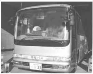
福祉バスの適正な運行を

子屈町乗合自動車運行規程に基づき貸し出している。今後さらなる適正な運用に努めていく。