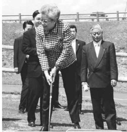
2005年に来町した呉儀中国副首相

問 2005年、呉儀中国副首相の来町をきっかけに、中国山東省青洲市視察団が来町し、その後、中国河南省商丘市長団が来町、友好交流に関する覚書を交換した。さらに、中国山東省泗水県ならびに濱州市濱城区と友好交流協定書に調印した。2006年には、中国友好3都市の訪問団が来町し、交流を深めてきた。日中友好交流10周年を節目に、何らかの交流事業を企画する考えはないか。