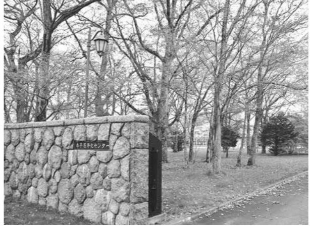
弟子屈浄化センターでの処理が最善

川湯、美留和地区における下水処理については、初期の建設費用や維持管理費用などのコスト面での比較、さらに自然環境への負荷を最小限に抑え、屈斜路湖の水質保全などの環境面も考慮した結果、川湯地域から連絡管を整備し、弟子屈浄化センターにおいて最終処理を行うことが最善の手法と考えている。将来は住宅や宿泊施設の減少が考えられるが、今後、下水道接続に係る普及活動に努め、水洗化率の向上を図りたい。