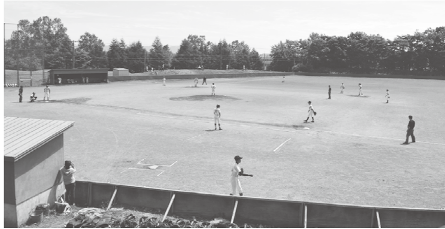
町営球場の駐車場改善を

社会の現在では駐車スペースが狭く、車道にも一部車を止めているなど、交通安全上支障が生じている。残地を活用して拡張することが最低限必要だと思いが、答弁を求める。