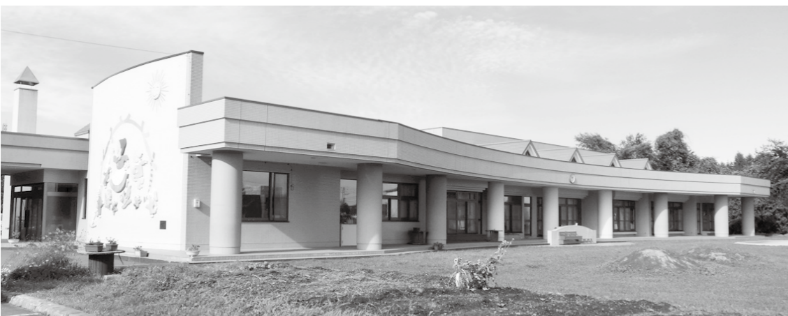
新制度によって保育園や幼稚園の運営はどう変わるのか

3法律の成立により、来年4月からの実施に向け、本町でも条例制定の準備作業中だと思ふ。現行制度と新制度を比較した場合、全体として学級編成、保育料の値上げなどはないのかを含めて、質の低下はないか伺う。新年度に向けて、保育所や幼稚園の運営方法に変化があるのかどうか。また、保護者向けの説明会の実施計画はあるのか伺う。