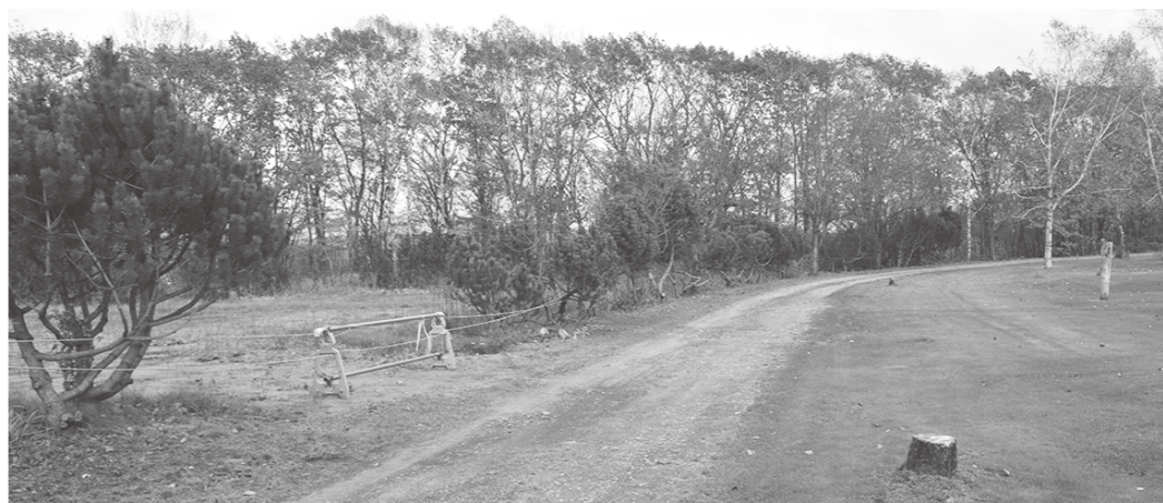
遊具が撤去された桜ヶ丘森林公園

問 町内には大・中・小含めて25カ所の公園やオートキャンプ場があるが、中には経過年数による腐食や劣化により遊具が撤去された施設