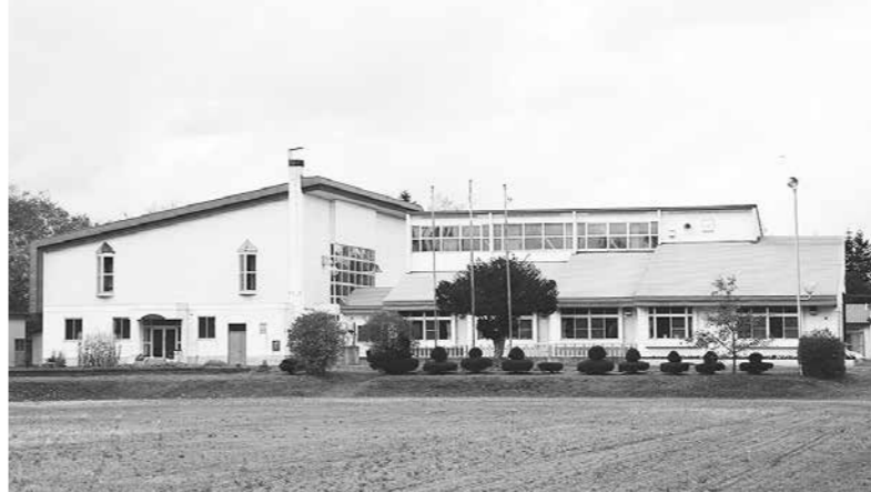
今年度で閉校する昭栄小学校

昭栄小学校は、来年3月末弟子屈小学校に統合、その後スクールバスで通学していただく。両校で統合準備を行っており、昭栄小学校の児童が引き続き楽しい学校生活を送れるよう対応していきたい。一方、昭栄小学校のPTAや南弟子屈自治会などが中心となって閉校事業協賛会を立ち上げ、本年11月16日に記念事業開催を計画。町補助金も交付している。同日、町主催の閉校式典も行う。小規模校4校の5年後の児童見込み数は、川湯小学校が現在と比較し8人増の46人、和琴小学校が2人増の12人、美留和小学校が1人減の12人、奥春別小学校が5人減の17人となっている。