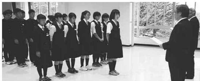
活躍する子どもたちに支援を

文化・スポーツ少年団や学校のクラブ活動などにおける本町の児童・生徒への支援は「弟子屈町スポーツ振興助成規則」に基づき旅費・宿泊費の助成を行っており、助成率も平成23年度からは6割から7割に引き上げるなど、出場にかかる費用の軽減を図っている。中体連・高体連が主催する大会などは、特に引率者に対しては全額助成を行っている。ま