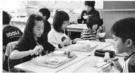
地元の食材を取り入れた給食を

問 子どもたちの健やかな成長を見守り、環境を整えてあげることは、われわれ大人の責務である。その中で学校給食は児童、生徒の成長を支えていく上で大変重要なことであり、提供する側は安心、安全な学校給食の提供に配慮しなければならぬと考える。そうした観点から地元食材を安心、安全に生産者が努力