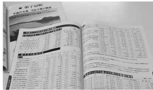
適切な財政運営を

問 町の財政は人口減とともに減少し、町税も10年前から1億6千万の減となり、町債も123億と大台を超え、唯一、町の貯金である基金はわずか5億弱と厳しい実態となっている。町村アンケートで全道の86%が近い将来「消滅しかねない」との危機感を持つているとの報道がなされる現状で、本町は財政見通しをどのように立案し、将来を見据