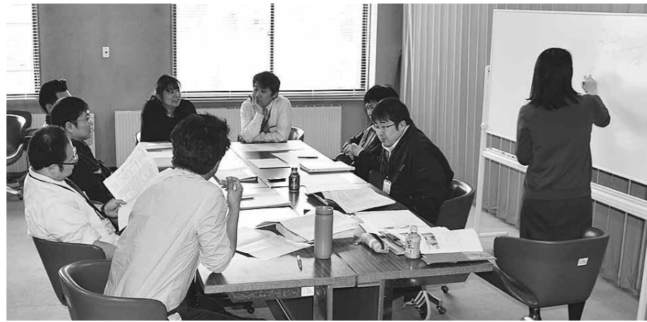
昨年発足した「人口問題に関する検討会」