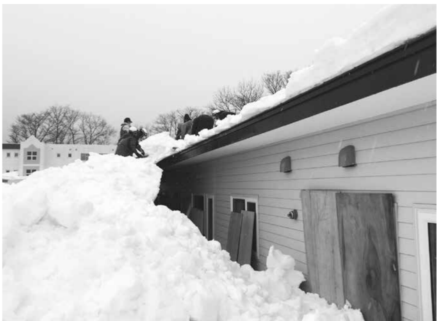
高齢者宅の雪下ろし支援の拡大を

問 高齢者の雪下ろし中に痛ましい事故が発生している。総務省は今年度から各自治体に対し特別交付税による措置を拡大し、「高齢者等の雪下ろし支援枠」を新設した。本町でも1日も早く国の制度を活用し、現在の玄関先だけの除雪支援ではなく、屋根の雪下ろしや居