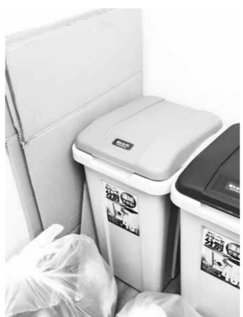
資源ごみ回収無料化の考えは

売をし、手数料も「燃やせるごみ」袋との比較では9分の1程度に留めている。ご指摘のとおり、確かに釧路管内でも資源ごみの有料化を実施しているのは本町のみである。資源ごみの無料化については町民各層の方々と意見交換を行い、今後の方針を決定したい。