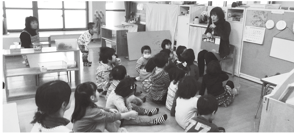
保育料支援の拡充を