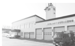
移転後の消防庁舎の暖房は