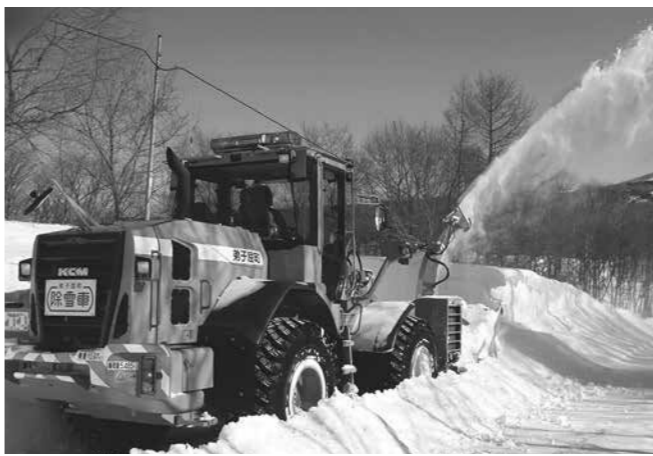
除雪作業の効率化を

問 25年度から5社が新規参入されたことによる車輛の性能、技術面の課題や問題点はどうか。直営で委託路線の除雪をしていく根拠は。また、除雪作業の効率化と経費の節減のため、事前に土地所有者から了解を得て雪置き場を拡大