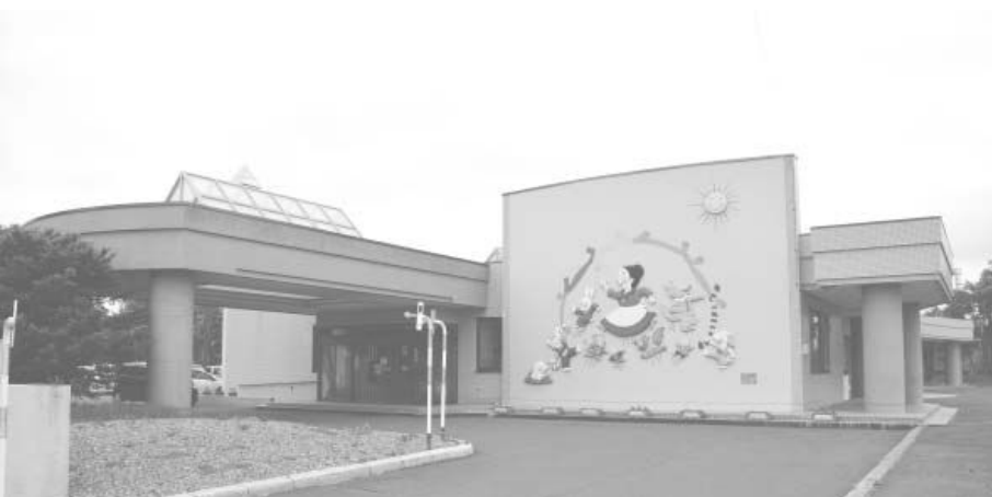
政策に合わせスムーズな対応を

政府は「新しい経済政策パッケージ」や「経済財政運営と改革の基本方針2018」において幼児教育・保育の無償化を2019年10月から実施を検討している。これに対し全国知事会から国の責任において必要な財源の確保、予算編成時を踏まえた実施時期の明確化、それに伴う各自治体での条例改正、保護者への周知など、さまざまな準備が必要であり、また税率の引き上げに係る歳入増が平成31年度中に見込めないことなどから32年度からの実施が望ましいとの緊急決議をしている。また、保育の現場からも施設の整備や保育士の育成が先ではとの指摘もある。