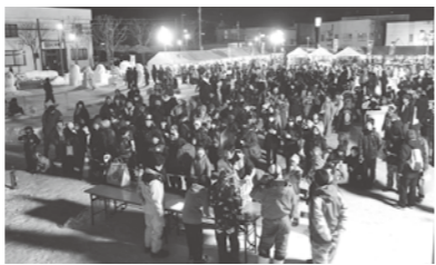
多くの人でにぎわったお楽しみ抽選会

摩周ウインターフェスタ2016 6（同実行委員会主催）が2月13日、ふれあいスペースで開催されました。イベントの少ない冬季の弟子屈町を活性化させようと毎年開催されているもので、今年で10回目。楽しみにしていた子どもたちや家族連れなど、たくさんの方が会場を訪れました。 会場には今年も、巨大な氷の滑り台が設置されたほか、チューブスライダーやバギーが子どもたちの人気を集めました。アイスキャンドルなどが飾られた会場では、ジャガイモ拾いやお菓子まき、アイスクリーム作り、お楽しみ抽選会、雪像作りなど趣向を凝らしたイベントが行われたほか、釧路管内の美味しい食べ物のお店が多数出店。本町の地域おこし協力隊も、みそおでんのお店を出店しました。また、氷上綱引き大会では、熱い戦いが繰り広げられました。 夜には、摩周冬空花火の打ち上げが行われ、観客からは歓声が上がっていました。