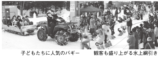
子どもたちに人気のバギー 観客も盛り上がる氷上綱引き

5月26日から2日間の日程で、三重県で主要国首脳会議（伊勢志摩サミット）が開催されます。警察ではテロを未然に防止するため、全国各地において、次のような警戒警備を行っています。 ●テロ関連情報の収集・分析 ●テロを企てる者などの入国を阻止する水際対策 ●爆発物原料となり得る化学物質の取扱業者への働き掛けや銃器対策 ●公共交通機関や大規模集客施設などの管理者と連携したソフトターゲット対策 ●重要施設に対する警戒警備 ▼警察からのお願い ●伊勢志摩サミットの開催に伴い、空港や港、駅などの警戒警備が強化されます。皆さんのご理解とご協力をお願いします。 ●不審な人や車、物などを発見した場合は、警察への通報をお願いします。