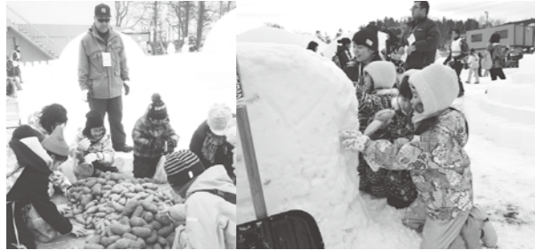
ジャガイモ拾い 子どもたちも雪像作りに挑戦