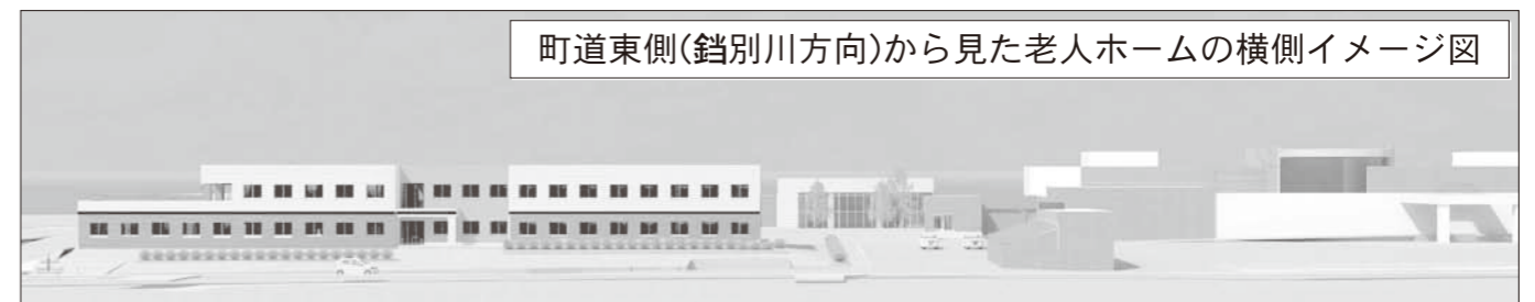
町道東側(鎗別川方向)から見た老人ホームの横側イメージ図

現在、建設予定地は立木の伐採が終了し、一部造成工事が始まっています。本体工事の着工は来年4月以降の予定です。