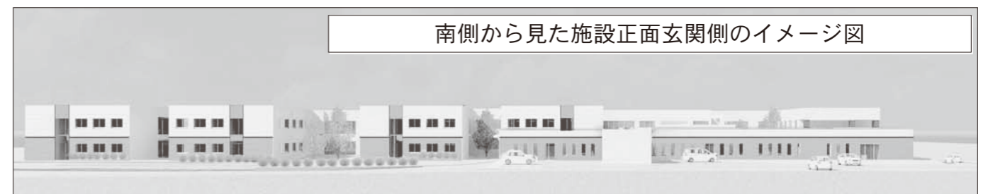
南側から見た施設正面玄関側のイメージ図