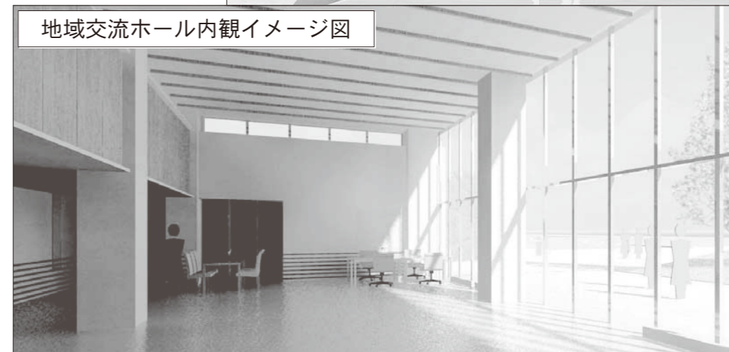
地域交流ホール内観イメージ図