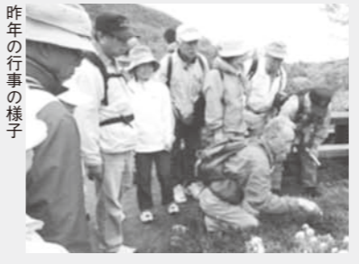
昨年の行事の様子

阿寒国立公園の特別な自然環境を実感してもらうための行事を開催しています。解説を聞きながら歩き、一層、理解を深めましょう。今回は、つつじヶ原を歩きます。 ▶期日 / 6月23日(日) ▶集合・解散場所 / 当センター ▶参加費 / 300円(保険代) ▶定員 / 15人(先着順) ※申し込み・問い合わせは電話で受け付けます。ホームページ( http://www6.marimo.or.jp/k_emc/ )もご覧ください。