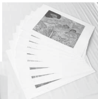
葎の葉の下の小さい神さま コロポックル