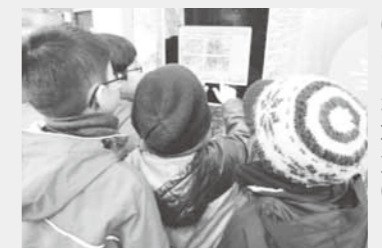
館内探勝路ではタッチパネルのクイズに挑戦

6月に入る と、イソツツジの開花情報を求める問い合わせが多くあります。イソツツジは高山や湿原、海岸などに生育する植物です。でも、硫黄山麓に広がるつつじヶ原は標高1700ほど。しかも火山灰地です。このような状況の1000秒にも及ぶ広大なお花畑は、自生地として日本一の規模を誇ります。