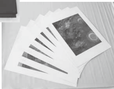
一番偉い鼻の神さま