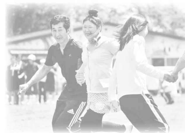
税金は住みよいまちづくりのための大切な財源です