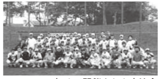
初めて開催された交流会

夏休み児童・生徒 作品展を開催 日時/9月13日(木)~9月20日(木)、いずれも9時~21時 場所/公民館1階ロビー