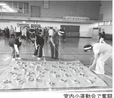
室内小運動会で奮闘

川湯青少年会館で8月8日、弟子屈学級、川湯学級合同室内小運動会を行いました。紅白に分かれ、でかパン競争やあんパン釣り競争、玉入れなど軽スポーツを通して両学級の交流を図り、親睦を深めました。体を動かす種目だけではなく、頭の体操としてカード合わせを行うなど、和気あいあいと楽しみました。