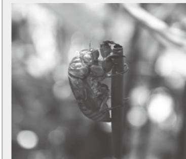
和琴ミンミンゼミの抜け殻

屈斜路湖の和琴半島では、ササの葉裏やトクサの先端に、国の天然記念物である和琴ミンミンゼミの抜け殻が付いていることがありますので、探してみてください。