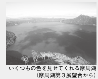
いくつもの色を見せてくれる摩周湖(摩周湖第3展望台から)