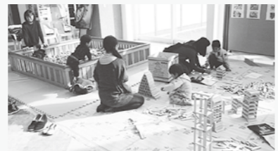
昨年のフェアの様子

予約・問い合わせ先/釧路総合振興局森林室 ☎ 0 1 5 3 ⑤ 2 1 6 5