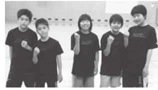
弟子屈RC少年団の皆さん