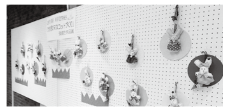
かわいらしいうさぎのマスコットたち

6月2日から20日まで、公民館ロビーで、生きがい講座の弟子屈学級の学習の中で学んだ手芸作品「うさぎのマスコット」20点の展示が行われました。来館者の皆さんは、一つ一つ違った表情のマスコットを見て、楽しんでいました。