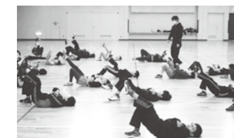
弱点の改善を目指して