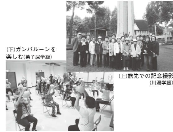
(上) 旅先での記念撮影(川湯学級) (下) ガンバルーンを楽しむ(弟子屈学級)

川湯学級では6月9日、「あの町この町を訪ねて」をテーマに施設見学を実施。学級生17人が参加しました。ひがしもこと乳酪館、網走市天都山オホーツク流水館、北海道立北方民族博物館などを見学しながら、学級生同士の親睦を深めました。 弟子屈学級では6月21日「健康な生活を送ろう」をテーマに、健康体操ガンバルーンに挑戦。学級生50人がストレッッチとゲームで体を動かし、楽しみました。