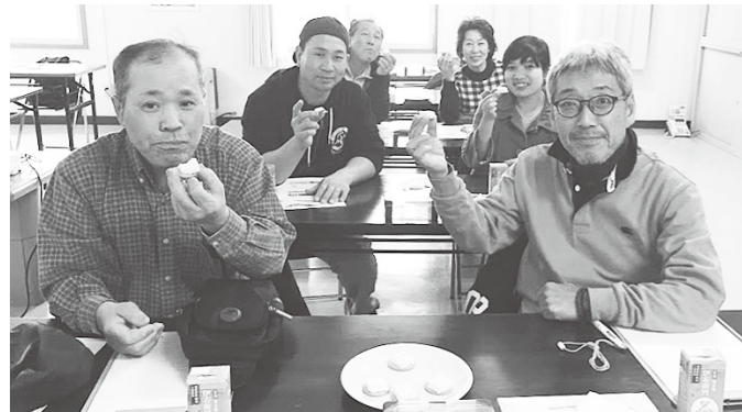
工場見学で出来たてのバターを試食

地域おこし協力隊facebook(フェイスブック) https://www.facebook.com/teshikagachiikiokoshi/