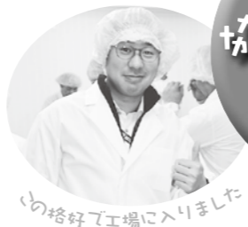
「格好で工場に入りました」