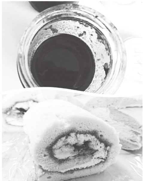
山幸ジャム(上)と検討中のスイーツ

さて、本町のワイニの原料となるブドウは「山幸」という品種です。山幸は山ブドウの系統を引き継