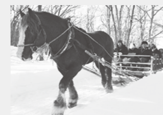
2月25日まで硫黄山ヒストリーツアー 催行中(摩周湖観光協会主催)

存在は不 旅行者の 国内 て、国内 前段とし を増やす を日外国 訪日外国 人利用者 を日外国 訪日外国 人利用者