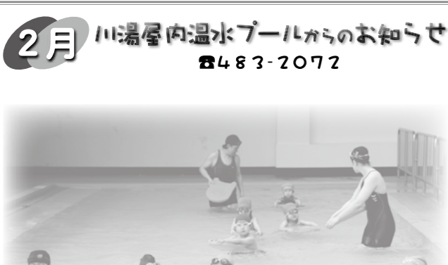
2月 川湯屋内温水プールからのお知らせ ☎483-2072

内閣府では、次代を担う国際感覚豊かな青年リーダーを育成するため、青年国際交流事業を実施しています。 現在、2017年度の国際青年育成交流事業「日本・韓国青年親善交流事業」「東南アジア青年の船事業」「次世代グローバルリーダー事業」「シップ・フォー・ワールド・ユース・リーダーズ」地域課題対応人材育成事業「地域コ