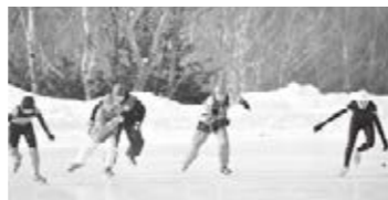
熱戦を繰り広げる選手たち

小学生スピードスケート大会 町スピードスケート少年団主催の平成28年度弟子屈町スピードスケート大会が2月4日、町営スピードスケート場で開催されました。大会には、子ども19人、大人6人の25人が参加。各種目ごとに分かれ、日頃の練習の成果を競いました。