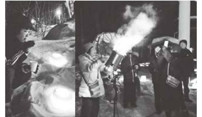
シャボン玉が凍ってびっくり