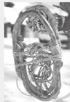
軟雪用かんじき「テシマ」