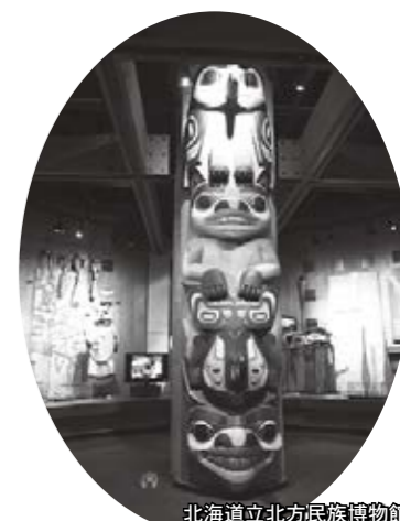
北海道立北方民族博物館