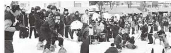
観客も盛り上がる氷上綱引き