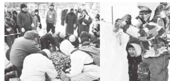
人気のジャガイモ拾い 子どもたちも雪像作りに挑戦