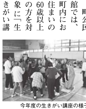
今年度の生きがい講座の様子

学級生募集! 町公民館では、町内にお住まいの60歳以上の方を対象に「生きがい講座」を開催しています。心身の健康と生きがいを求め、明るく家庭づくりと社会参加、豊かな地域づくりに役立つことを目的としています。 学習内容は、野外活動・体力づくり・体験学習などを取り入れ、毎月1回、弟子屈学級・川湯学級でそれぞれ実施します。 月別の学習内容は下の表のとおり計画していますので、入学を希望される方は申し込みください。 ※日程などは変更になることがあります。 ▼3月の生きがい講座/「明日への生きがいを持つ」と「閉講式」(弟子屈学級・川湯学級とも) ●弟子屈学級/3月13日(月) 町公民館講堂 ●川湯学級/3月16日(木) 川湯ふるさと館