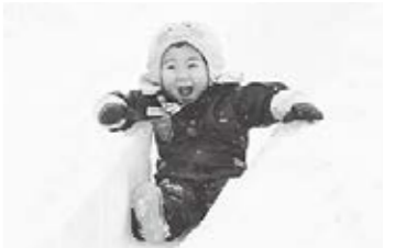
大人気の雪と氷の滑り台

摩周ウインターフェスタ2017(同実行委員会主催)が2月11・12の両日、ふれあいスペースコラールで開催されました。イベントの少ない冬季の弟子屈町を活性化させようと毎年開催されているもので、今年で11回目。楽しみにしていた子どもたちや家族連れなど、たくさんの方が会場を訪れました。会場には今年も、巨大な雪と氷の滑り台が設置されたほか、チューブスライダーやバギーが子どもたちの人気を集めました。アイスキャンドルなどが飾られた会場では、ジャガイモ拾いやお菓子まき、アイススクリーム作り、お楽しみ抽選会、雪像作りなど趣向を凝らしたイベントが行われたほか、おいしい食べ物のお店が多数出店。本町の地域おこし協力隊も、鳥がらだし茶漬けのお店を出店しました。また、氷上綱引き大会では、熱い戦いが繰り広げられました。11日には、摩周冬空花火の打ち上げが行われ、観客からは歓声が上がっていました。