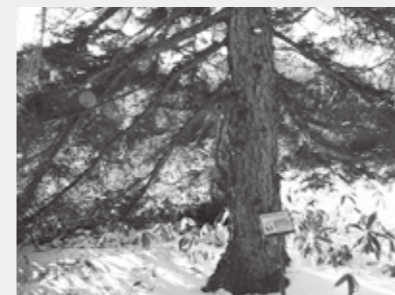
センター裏手にはアカエゾマツの森が広がっています

樹木類では、アカエゾマツもその一つです。枝が下向きに付くため屋根代わりとなり、根元は野営する場となりました。松葉は燃やして暖を取るのに重宝しました。冬場でも命を守ってくれる「女神のような木」と称されました。