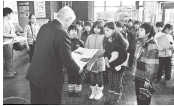
徳永町長に自作のポスターを手渡す児童