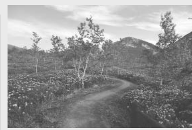
景色を楽しみながら歩きませんか