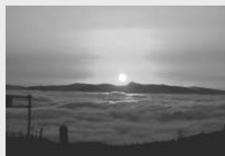
美幌峠からの雲海

きた窪地―カルデラがあらつます。その窪地に水がたまり、摩周湖や屈斜路湖のようにカルデラ湖と呼ばれるようになります。カルデラは盆地のような地形となるため、夏には温かい空気が、冬には冷たい空気がたまり、寒暖の差が大きくなります。