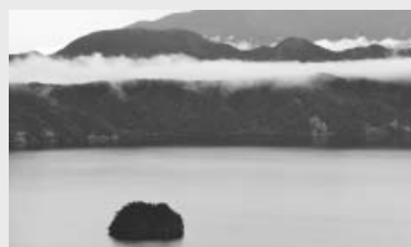
山、中島、湖のすべてにカムイが付いている摩周エリア

道内にはカムイ(神)と付く地名がいくつかあります。最上級の美しさを形容している一方で、急峻な崖に囲まれた山奥など、近寄り難い場所を表すこともあります。共通しているのは、アイヌ(人間)が「自分たちでは創れない、神の力が成せる業」と驚嘆した景観であること。カムイヌプリ(神の山)がそびえ、カムイシュ(神のおばあさん)と呼ばれる中島、それを抱くカムイトー(神の湖)という名は、伝説も多く残す摩周エリアの原始の姿を今に継いでいます。