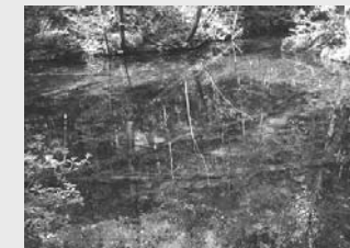
太陽光の加減などで青く見えます