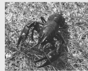
ハサミの根元の白さが特徴のウチダザリガニ

テクンペコルカムイ(手袋を持っている神)と呼ばれたザリガニ。ハサミの形が手袋や手甲に似ていることから名付けられました。昔の屈斜路湖では、魚網にザリガニがかかると焼いたり食べたりせず、速やかに湖中へ戻したそうです。今の屈斜路湖は、ほとんどが特定外来生物に指定されているウチダザリガニとなってしまいました。「飼育」「生きたままの移動」などが法律で禁止されていますので、ご注意ください。