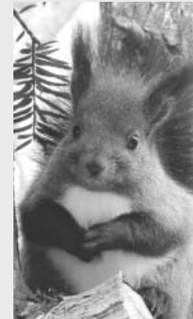
意外に不評?なエゾリス

肉は食用に、毛皮は交易品として利用されました。雪の上も元気に走り回るエゾリスですが、本格的な冬を前に貯食用のクルミ集めに大忙しの時期を迎えています。