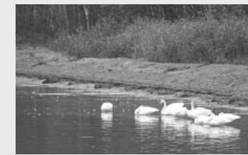
冬の使者オオハクチョウ

冬の間、川湯の森から約3km北に位置するシベリアから約2週間かけて飛んで来ます。特に、温泉がわき出ている屈斜路湖の砂湯やコタンは、長旅を終えたオオハクチョウたちにとつてはうつつの憩いの場所です。