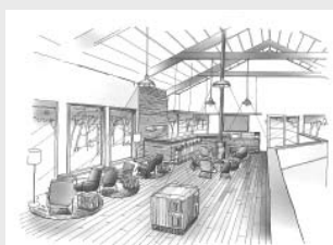
2階のカフェスペース(イメージ図)