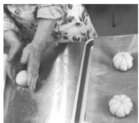
かぼちゃパンを手順通りに

塗りなどのお手伝いをいただき、焼きたてを試食。途中、いつも気にかけてくださる南弟子屈の方が訪ねてくれて、参加者と昔話を。いつもは静かな旧昭栄小学校の理科室から、大きな笑い声が響きました。