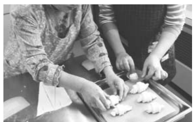
クロワッサンの成形をお手伝い

私が担当しているのは「パンづくり見学&体験」です。10月広報で案内させていただき、直後から多くの